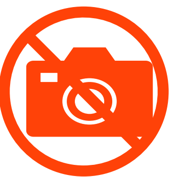
Bild- und Tonaufnahmen am ganzen Standort sind nicht gestattet.

Das Betreten mit einem Herzschrittmacher ist nicht gestattet.